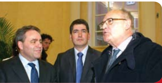
> Xavier BERTRAND, Secrétaire Général de l'UMP en visite à l'Orientoscope.le 9 mars 2010

L'Orientoscope vient d'achever sa première année de fonctionnement et affiche un franc succès : depuis son ouverture début