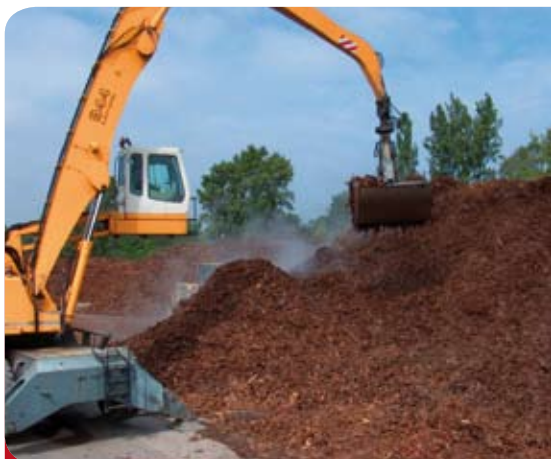
> Le trafic d'écorces décoratives en plein essor au port d'Ile Napoléon