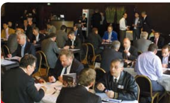
> 70 chefs d'entreprises au 3ème Speed meeting organisé par la CCI, le 27 avril 2010 au Casino de Blotzheim

série d'événements pour favoriser la mise en réseau d'entreprises : speed meeting (190 entreprises pour 1425 mises en relation), 15 rencontres de clubs d'entrepreneurs territoriaux, rencontres Entr'Actes à la Maison de l'Entrepreneur (125 entreprises)... Le site Alsace Industrie a été enrichi de 109 nouvelles entreprises : fin 2010 il référençait le savoir-faire de 845 entreprises industrielles régionales.